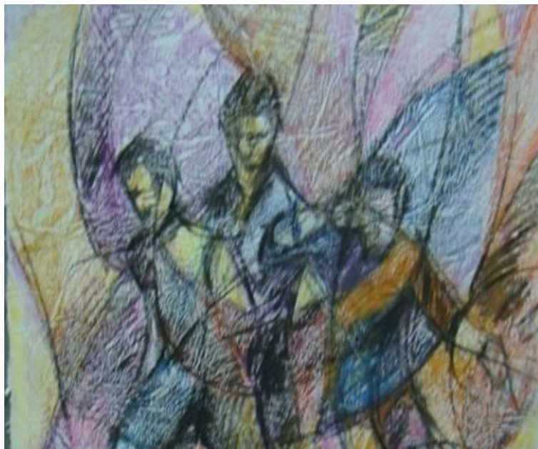
راه پیمایان قله ها