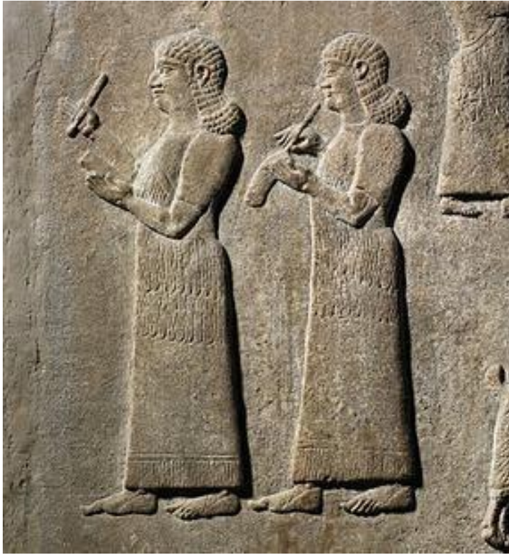
Dubsar və qələm