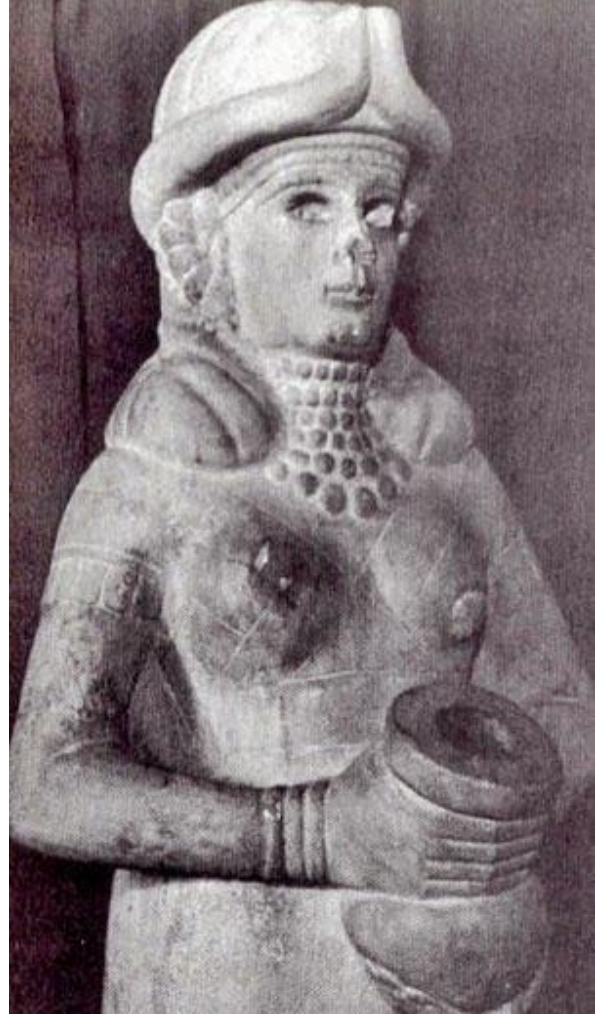
الہہ (زن) کی -ائن-گیر