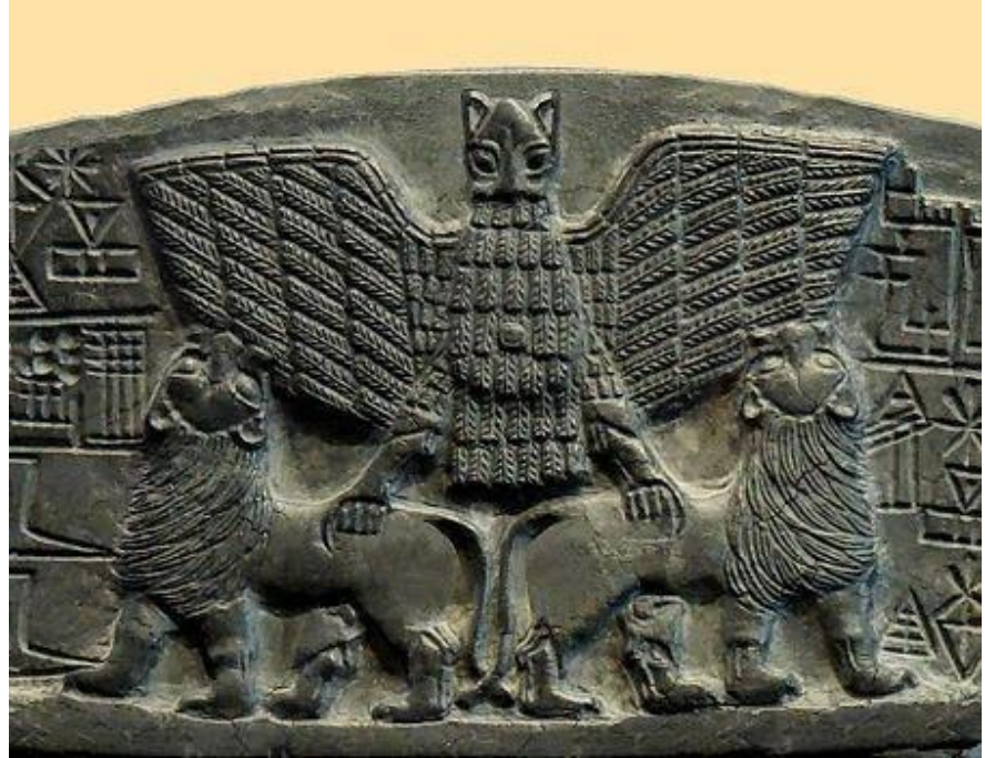
ایم-دو-قود بر روی شیرها