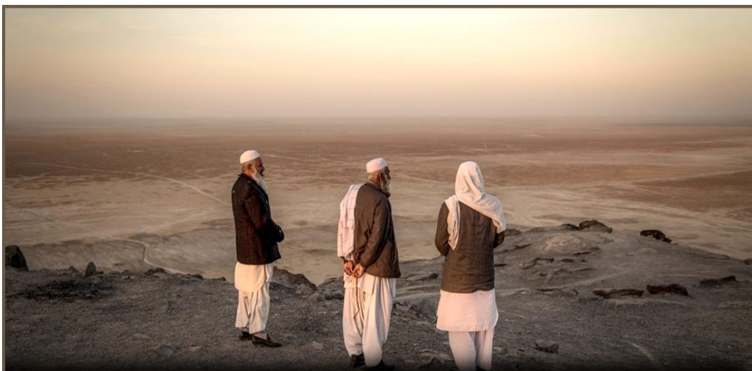
مردان سیستانی در سوگ هامون: آنجا که زمانی دریاچه بزرگ هامون بود. "چو این تبدیل‌ها آمد نه هامون ماند و نه دریا"

سوال اساسی اینجاست که چرا از ۱۵۰ دستگاه آب شیرین کن در کشور، سهم استان سیستان و بلوچستان فقط یک دستگاه آب شیرین کن فرسوده و قدیمی می باشد و علیرغم اینکه قرار است تعداد آب شیرین کن های کشور در عرض ده سال آینده بیش از دو برابر شوند، و قرار است با همکاری چین طرح تولید آب از طریق آب شیرین کن و انتقال آن به ۱۶ استان غیر ساحلی اجرایی شود، اجازه تاسیس آب شیرین کن در سواحل سیستان و بلوچستان صادر نمی شود؟ اما در استانهای دیگر تشویق می شود؟ علاوه بر امتناع از صدور مجوز آب شیرین کن، چرا آب پشت سدها که به سرعت در حال تبخیر است برای ادامه حیات صدها روستا رها نمی شود؟ چرا و چگونه استانی که علاوه بر فقر و